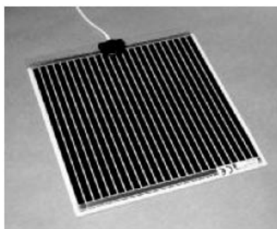
ECOFILM MHF - zadní strana